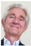
Jean-Paul CHANTEGUËT député PS de l'Indre