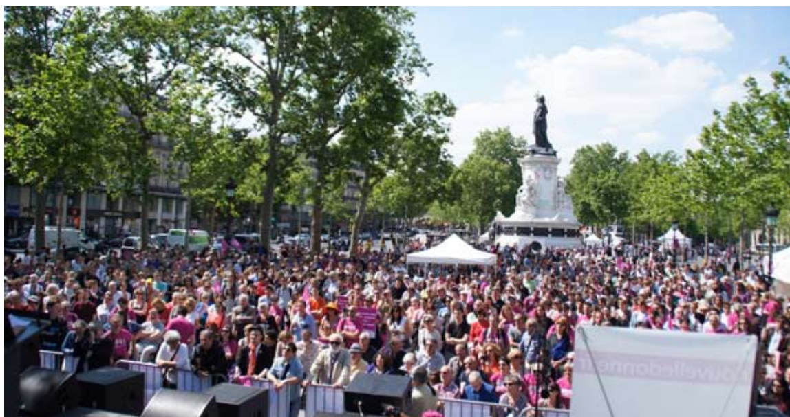
Place de la République Paris - Meeting 18 mai 2014