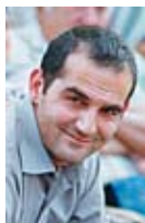
Pouria AMIRSHAHI , député PS de la 9ème circonscrip- tion des français établis hors de France